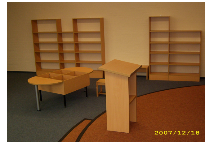
Podest mit großer Pyramide und Vortragspult