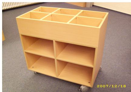
Bücherwagen für die Rückgabe